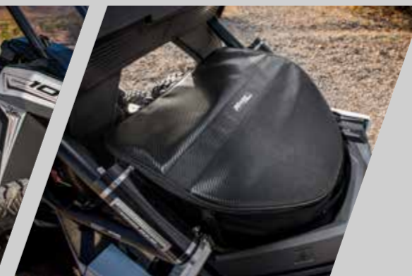
Sacoches de rangement