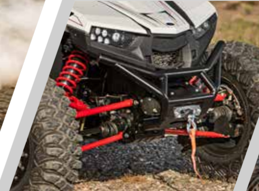
Pare-chocs avant et Treuil