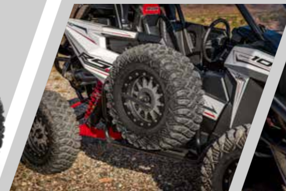
Support de roue de secours